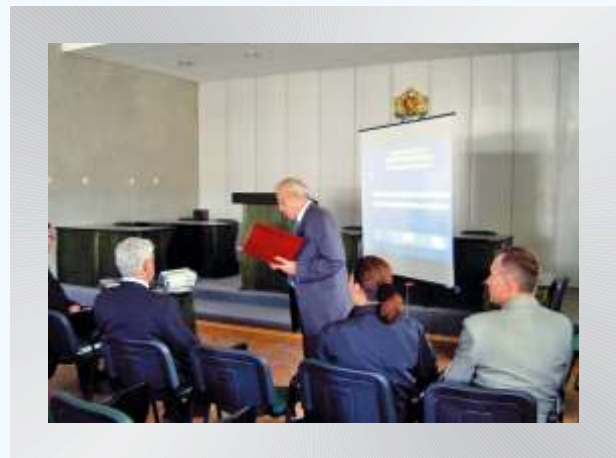
Г-н Петър Карагеоргиев, областен управител на Област Търговище открива презентацията на проекта.

Презентацията се проведе в конферентната зала на Община Търговище. Откри я областният управител г-н Петър Карагеоргиев. Присъства и кметът на града - д-р Красимир Мирев.