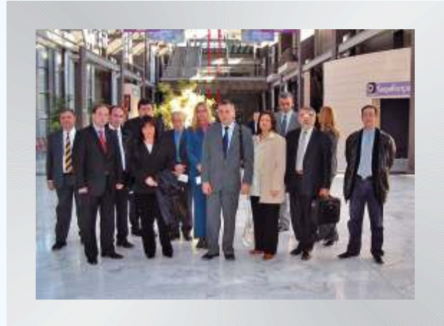
Българската делегация в Научния Център и Технологичен музей на Солун

изложбен център, конферентен център, център за отдих и забавления. На голяма площ са разположени експозиции, проследяващи развитието на технологиите в различни направления. Умело е съчетано едновременното присъствие на технологии от отминали времена и съвременни, ултармодерни мултимедийни технологии.